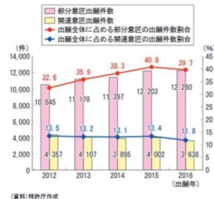
部分意匠、関連意匠の出願件数及び出願件数割合の推移

韩国在 2001 年开始对部分外观设计实施专利保护。韩国外观设计保护法第二条第一款规定：外观设计是指，产品（包括产品的部分和字体）的形状、模样、色彩或者它们的组合，通过视觉来引起美感。